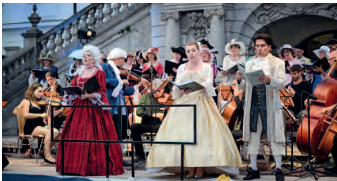
Schlossfest „Zauber des Rokoko“